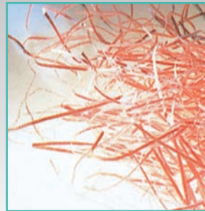
■ストレートカット